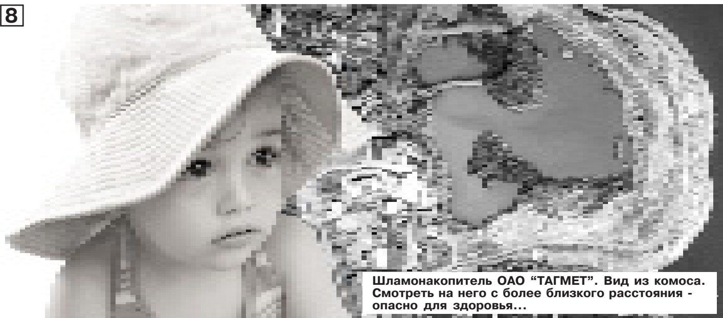
Шламонакопитель ОАО «ТАГМЕТ». Вид из комоса. Смотреть на него с более близкого расстояния - опасно для здоровья...