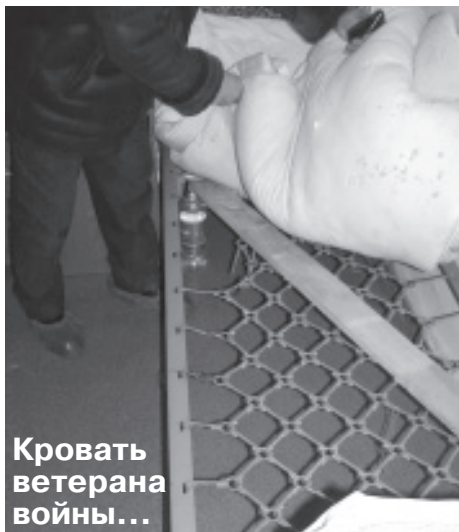
Кровать ветерана войны...