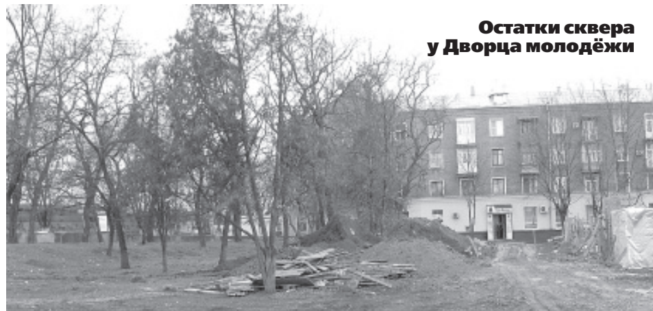
Остатки сквера у Дворца молодежи

И вот наш мэр опять не удержался от искушения «откусить» и продать напоследок еще кусочек парка. Под окнами девятиэтажек, по границе парка, прямо в праздник святой Пасхи какие-то безбожники начали копать фундамент под суши-бар. Характерно, что с парадным входом на улицу С.И.Шило, а не в парк. То есть к парковой инфраструктуре этот объект можно отнести с весьма большой натяжкой. Жителей соседних домов, понятно, перспекти-