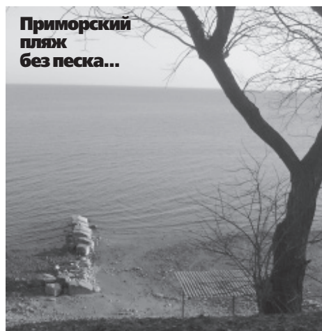
Приморский пляж без песка...

Это характерный пример того, что граждане могут добиваться результатов, объединившись. И забирать обратно свое даже у такого крупного градообразующего предприятия, как ОАО «ТАГМЕТ», не привыкшего терпеть поражений в судах.