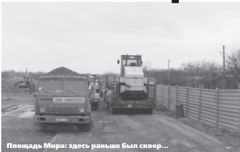
Площадь Мира: здесь раньше был сквер...

Думает ли наш мэр, давая очередное разрешение на уничтожение очередного сквера о том, что в городе скоро будет нечем дышать? И если нет,