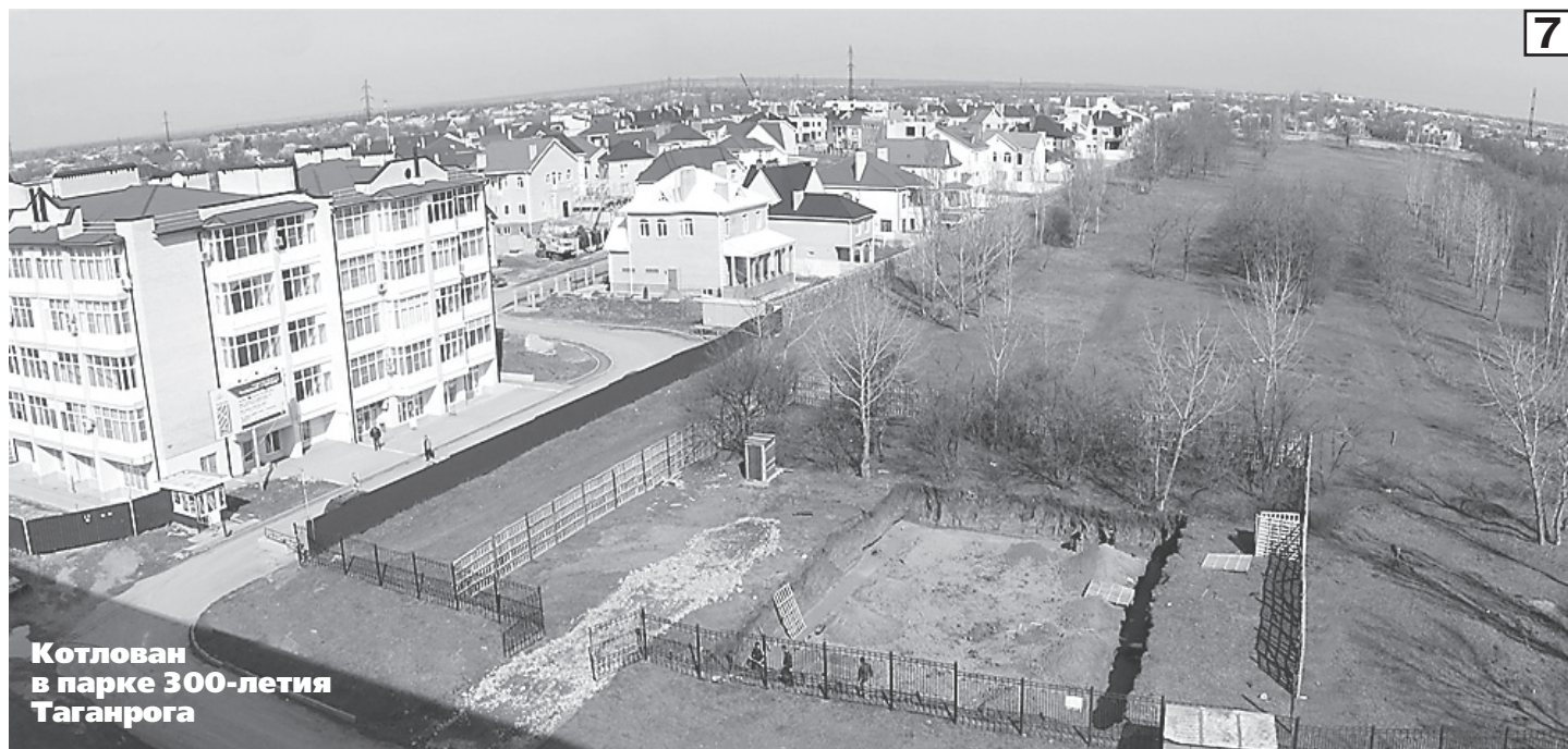
Котлован в парке 300-летия Таганрога

вы такого соседства не радуют. Суши у нас едят далеко не все, а громкую музыку и пьяные вопли по ночам, обычно сопутствующие предприятиям общепита, терпеть придется постоянно.