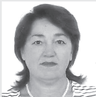
всем понравилась. Люди нам верят, приходят за советом. Всех, кто меня знает, прошу поддержать на выборах нашу команду!