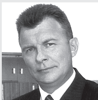
пассажиров удобнее. Не понимаю, почему сегодняшнее руководство поселения это не понимает. Может потому, что в этих ужасных маршрутках в город никогда не ездит?

Первый заданный им мне вопрос был такой: «Когда меня изберут Главой поселения, я хотел бы организовать движение больших автобусов в город для жителей села. Люди просят. Поможешь?». И я обещал помочь. Действительно, большие автобусы для