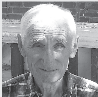
Он - мужик человеческий, каких мало. Я буду голосовать за него!

Впоследствии администрация компенсировала затраты по задолженности за подключение газа.